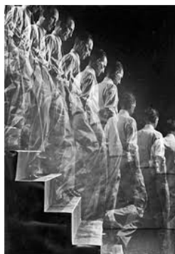
Duchamp-Nudo che scende le scale

Un altro personaggio fondamentale per le sue sperimentazioni sarà anche Etienne Marey, che elabora il metodo detto cronofotografia su lastra fissa, sulla quale registra le varie sequenze di un movimento, mentre una decina di anni dopo riprodurrà le varie fasi in successione del movimento non più su lastra