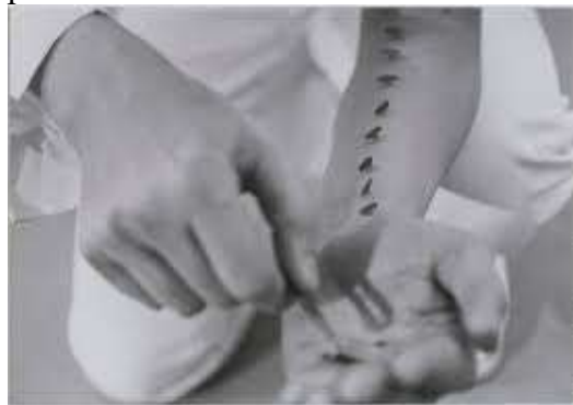
Gina Pane-Body Art

Negli anni successivi non mancherà la commistione tra fotografi puri e artisti , che si farà molto più labile intorno agli anni '70 del secolo scorso con la body art per esempio, perché a imporsi saranno i processi strettamente meccanici del mezzo, al fine di registrare esattamente l'elemento