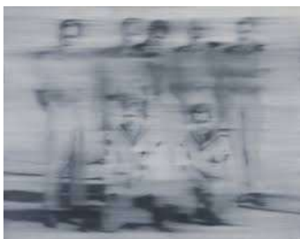
Richter Gerhard - Marinai

Come per altre branche dell'esperienza artistica anche per la fotografia, come affermato poco sopra, possono sussistere diverse correnti di pensiero. a) Una prima considera la fotografia lo strumento privilegiato di riproduzione del reale, anche più di quella dell'occhio, secondo dettami estetici, b) una seconda privilegia la tendenza creativa secondo la sensibilità del fotografo.