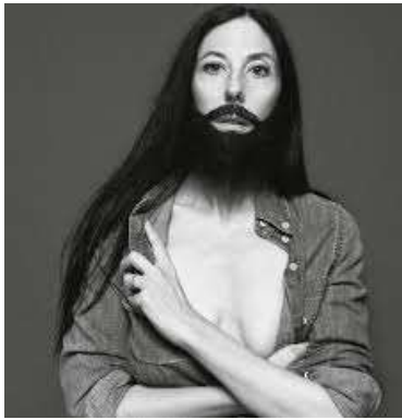
Inez van Lamsweerde - The gentlewoman

e qualche altro che nella mostra: “Viaggio in Italia” presentarono paesaggi italiani visti con occhio diverso rispetto a una certa tradizione cartolinesca. Le immagini erano sostenute, invece, da un forte impianto concettuale il quale funzionava come sintesi di un processo di relazione offerto virtualmente al fruitore. Nel frattempo, in campo medico, cominciano le manipolazioni estetiche del corpo, accolte di buon grado dalla cultura di massa poiché si comprese che il corpo umano poteva essere modificato a proprio piacimento.