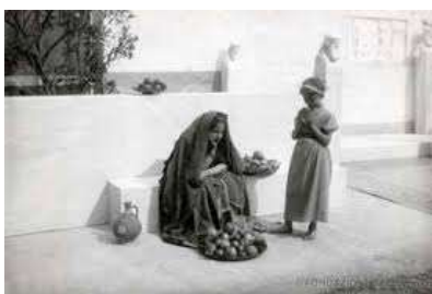
Gustave Le Grey

In Italia, “patria di santi, artisti e navigatori”, il pittorialismo non poteva non trovare proseliti già sul finire dell'Ottocento ad opera del torinese Guido Rey (1861-1935) con due mostre realizzate a Torino, la prima nel 1898 e la seconda nel 1902 sostenute anche da una famosa rivista: "La fotografia artistica".