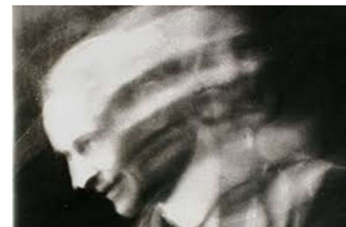
Anton Giulio Bragaglia

tra le sue fila la fotografia e i fotografi, anzi alcuni artisti (Boccioni, Balla, Carrà, Severini...) ne prenderanno le distanze, sostenendo che essa non ha nulla a che fare: "col dinamismo plastico da noi inventato."