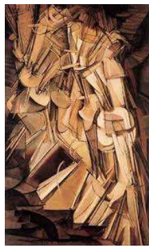
fotografare mentre scendeva dei gradini, da cui poi

ma su pellicola. Comanderete che siamo di fronte a quello che sarà qualche anno dopo il cinema dei fratelli Lumière del 1895. Una notazione assai interessante riguarda Duchamp e il celebre: "Nudo che scende le scale" (1912). In un'intervista del 1967 l'artista dichiara di essersi servito della cronofotografia . Infatti, si era fatto