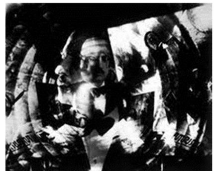
Tato: Ritratto di Marinetti

La prima e dirompente sarà il Futurismo, che all'inizio non accetterà