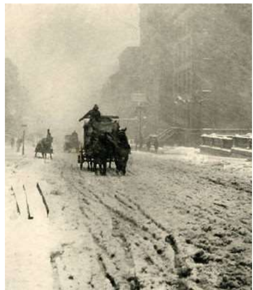
Stieglitz: Tram a cavalli nella Quinta Strada

Per questo infaticabile maestro, la fotografia “è un mezzo particolare di espressione individuale.” Infatti, ne rivendica la dignità e l’importanza espressiva e realizza immagini che per l’epoca sbalordiscono. Scatta fotografie durante tempeste di neve, come quella riportata, oppure durante giornate di pioggia. Le straordinarie immagini che ottiene senza usare