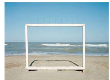
L. Ghirri - L'enigma fotografia

Non poteva in questo contesto non entrare in gioco la tecnologia digitale con le immagini dell’olandese Inez van Lamsweerde che mette in scena adolescenti ibridati, simboli di un mondo artificiale popolato da creature indefinite e senza età.