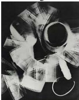
Man Ray: rayogramma

Non mancheranno di interessarsi alla fotografia i surrealisti , poiché questa dava la possibilità di esprimere l'ambiguo rapporto con la realtà. Infatti, essi fotografano oggetti che poi deformano, spezzettano... fino a fare assumere loro un significato totalmente diverso da quello che avevano in origine