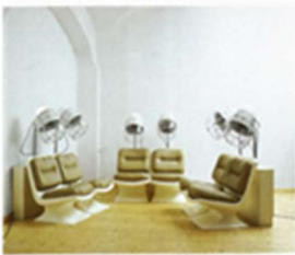
Giovanni Albanese - Shampoo '70, 1999 - Installazione

Maestro: “Mia cara, immaginiamo un avvocato, un letterato, un operaio che visiti per la prima volta una biennale, un museo di arte contemporanea, una galleria ... e vede una stanza con sei poltrone con caschi di parrucchiere per signora, in un'altra grandi cumuli di materiali edili sul pavimento oppure un'enorme teca con un centinaio di palloncini gialli che volteggiano o dieci metri di tela verde distesa tra pavimento e muro e così via, cosa dirà il nostro visitatore? E cosa dirà un vecchio artista come me?”