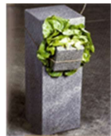
Giovanni Aselmo - Senza titolo - Centre Pompidou - Parigi

L.P.: E... lo so, me lo ha ripetuto tante volte. L'arte per comunicare un pensiero deve essere un in/contro con l'altro da sé, come, del resto, avviene per la medicina, la politica, l'ingegneria, la danza, la poesia, le arti visive in genere, fotografia compresa.